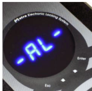
Alarm na čitalniku kartic