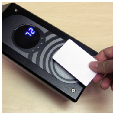
Čitalnik identifikacijskih kartic